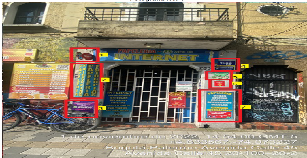
Fotografía No. 4

En la cual se evidencian siete (7) elementos PEV pertenecientes al establecimiento comercial PRODYSER ELECTRONIC , los cuales son adicionales al único elemento permitido por fachada de establecimiento comercial.